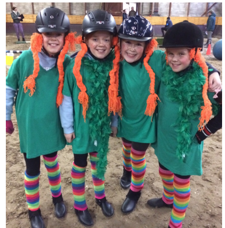
De Pipi Langkousen