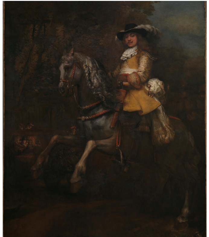
Ruitersportret van de rijke bankier Frederick Rihel (1621-1681). Late Rembrandt.

wordt een zogenaamde levade uitgevoerd, een ogenschijnlijk moeiteloze maar uiterst moeilijke beweging voor zowel de ruiter als het paard. Een geoefend paard kan deze houding slechts een seconde of 5 vasthouden. Door deze beweging uit te voeren laat de ruiter zien dat hij de rijkunst tot in de puntjes beheerst, wat symbool staat voor zijn uitmuntende leiderschapskwaliteiten.