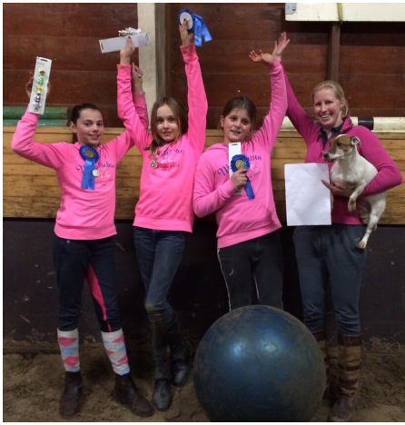
Het winnende team